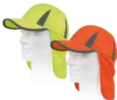
amarillo a.v. naranja a.v.

Talla: única Composición: 100% Poliéster