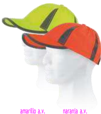
amarillo a.v. naranja a.v.

Talla: única Composición: 100% Poliéster