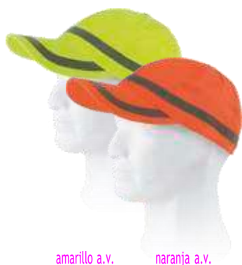
amarillo a.v. naranja a.v.