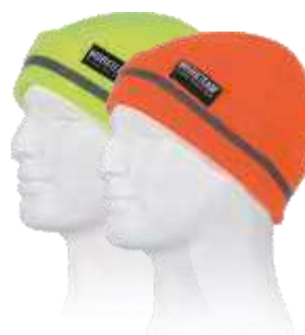
amarillo a.v. naranja a.v.

Talla: única Composición Ext.: 100% Acrílico Composición Int.: 100% Poliéster