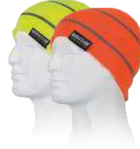
amarillo a.v. naranja a.v.