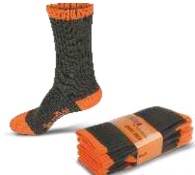
verde caza/naranja a.v.